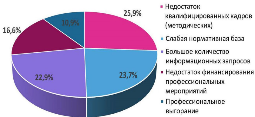
Рис. 2. Проблемы в методическом обеспечении деятельности библиотек Сахалинской области

Конечно, были названы и проблемы в методическом обеспечении деятельности библиотек в целом по региону. Руководители ЦБС и специалисты методических служб области в первую очередь отнесли к ним недостаток квалифицированных (методических) кадров (25,9%), слабую нормативную базу для методической деятельности (23,7%) и большое количество информационных запросов (22,9%). В меньшей степени на методическую работу влияют недостаток финансирования профессиональных мероприятий (16,6%) и профессиональное выгорание (10,9%) (рис. 2).