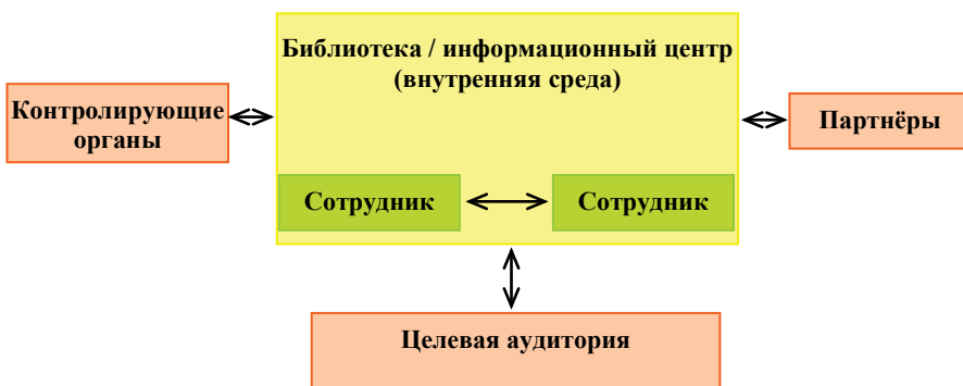
Рис. 1. Коммуникационное пространство библиотечно-информационной сферы

Коммуникационная среда может иметь специфические черты в зависимости от сферы деятельности. Она состоит из внешней и внутренней среды. К внутренней относят коммуникации между сотрудниками, к внешней – взаимодействие с целевой аудиторией, партнёрами и контролирующими органами (рис. 1).